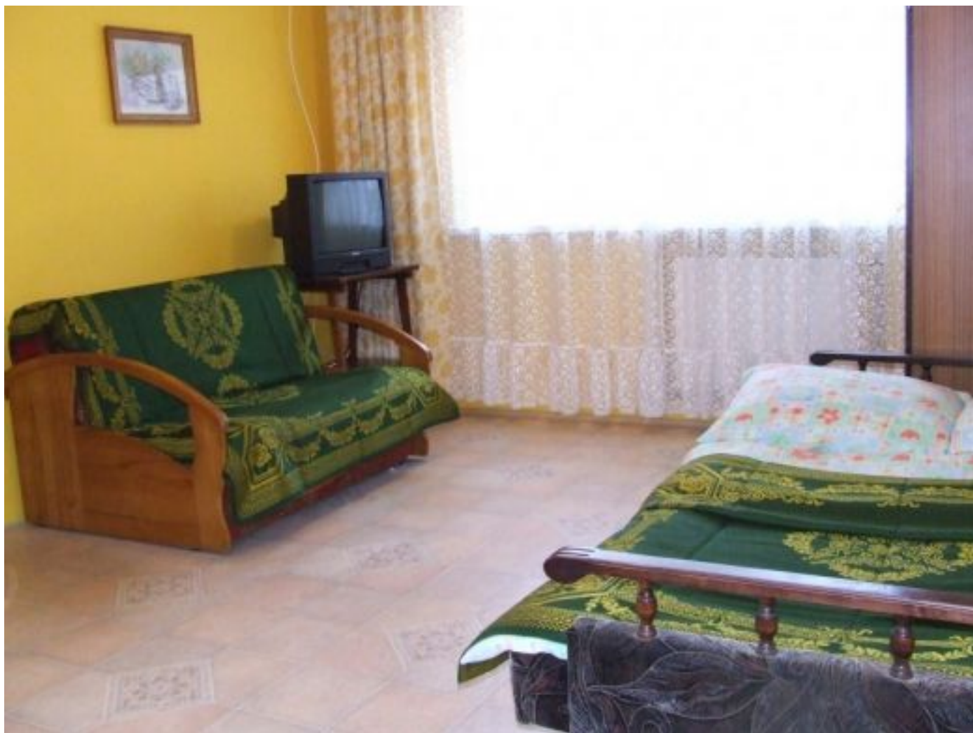
pokoj i kuchnia.jpg