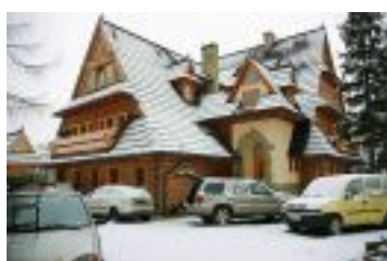
Willa wojciechowo zima