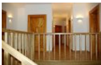
Willa wojciechowo zakopane

Zapewnione jest wyżywienie w postaci śniadania i obiadokolacji.