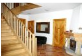
Willa wojciechowo zakopane

Pokoje jedno- i dwuosobowe jak również 3 apartamenty posiadają niskotemperaturowe ogrzewanie centralne. Łazienki z kabinami prysznicowymi, wyposażone są w grzejniki drabinkowe. Przedpokoje i łazienki mają ogrzewanie podłogowe. Wszystkie pokoje mają balkony z przepięknymi widokami na Giewont, Nosal i skocznie narciarskie. Wyposażone są w telewizory. W pensjonacie jest ponadto narciarnia, sauna i sala klubowa.