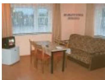
Jeden z pokoi