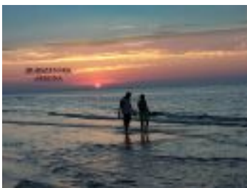
Spacer przy zachod±cym S³oñcu